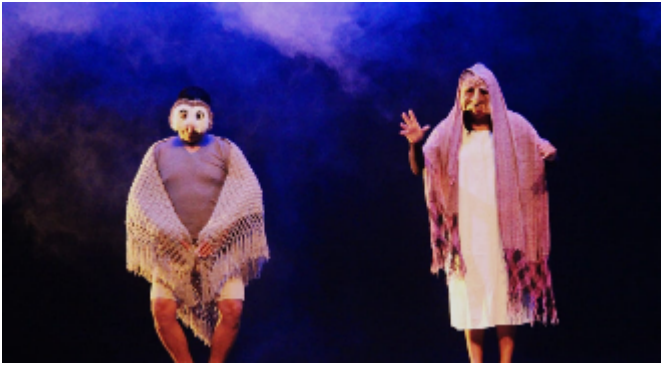
JLool y los pájaros que presagian la muerte, 2020,