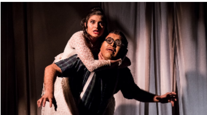
Freak Show / 2019 / Fotografía: Ernesto Jiménez