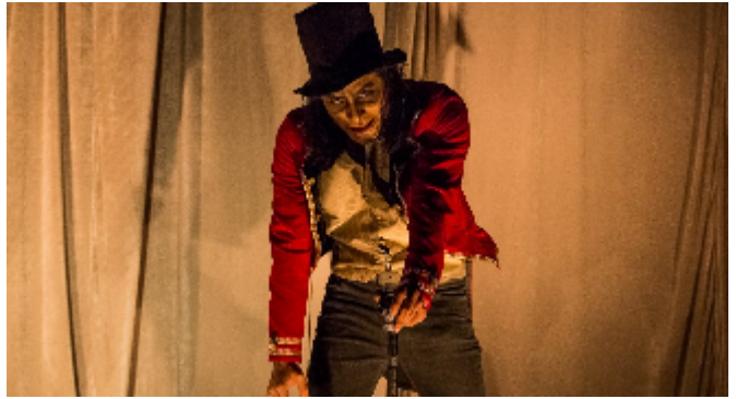
Freak Show / 2019