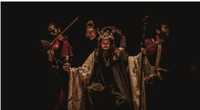
Dr. Nigromante, el conjuro final / 2022