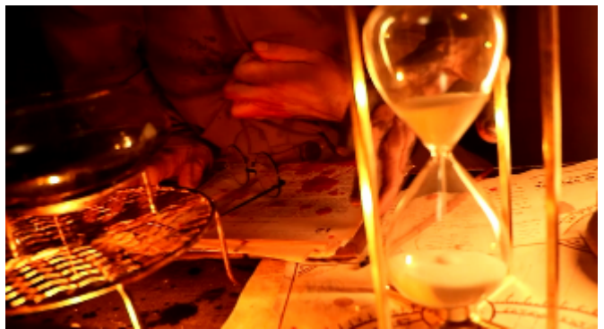
Fausto / 2020