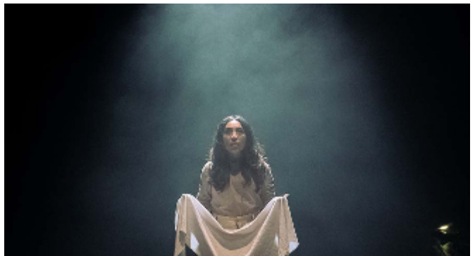
Mnemósine Sublimada / 2022