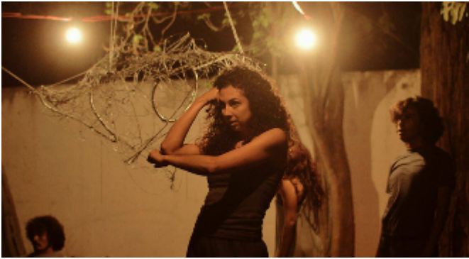
Marañas / 2017 / Autor desconocido