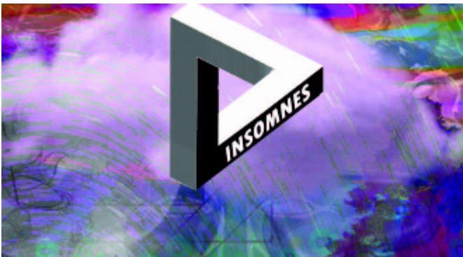
INSOMNES / 2021