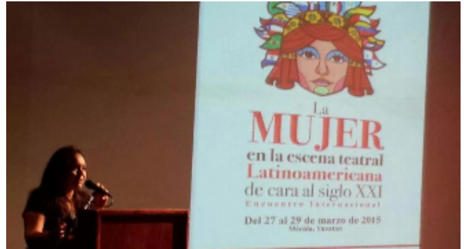
Inauguración 1er encuentro Mujer y Teatro en la Cineteca del Teatro Armando Manzanero (2015)