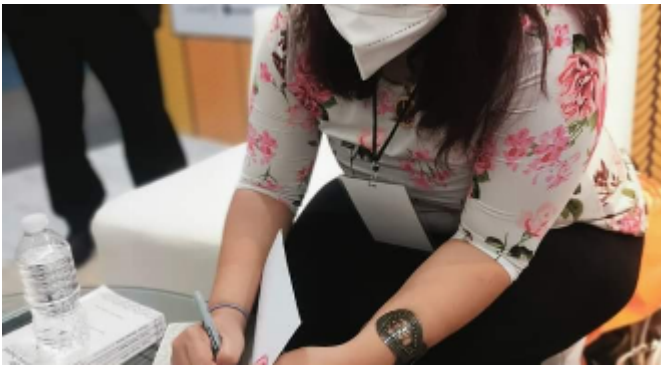
Presentación de libro: "La Mujer en la Escena Teatral Latinoamericana" en la FENAL 2022

https://www.youtube.com/watch?v=HINGR32Pbf4