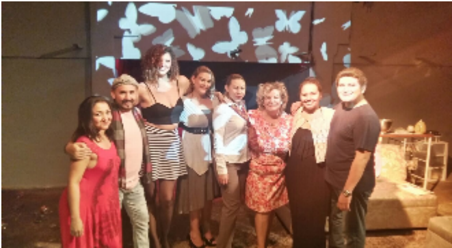
Equipo de la puesta en escena: "Connecting People" en Teatro de La Rendija (2016)

Nacional "Pensar la escena" (2018 y 2021). Moderadora en conversatorios relacionados con temas de teatro y cultura. Docente en la UAM.