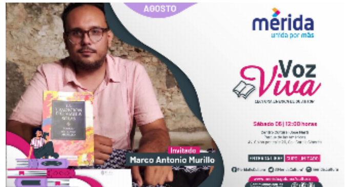
Voz Viva 2022