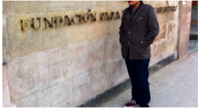
Fundación para las Letras Mexicanas