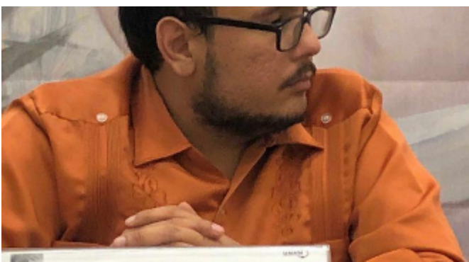
Feria Internacional del Palacio de Minería