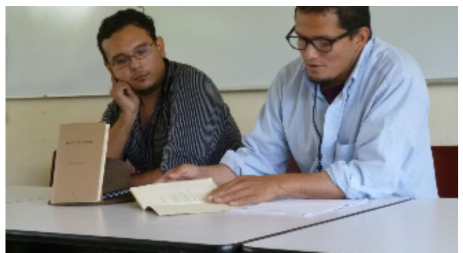
Presentación de Muerte de Catulo en Palizada (2010)