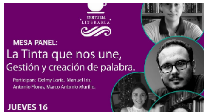
La tinta que nos une 2021