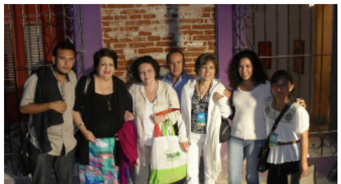
VIII Encuentro de Poesía Carlos Pellicer