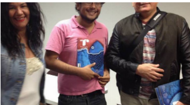
Presentación de Río Grande Review, 2013