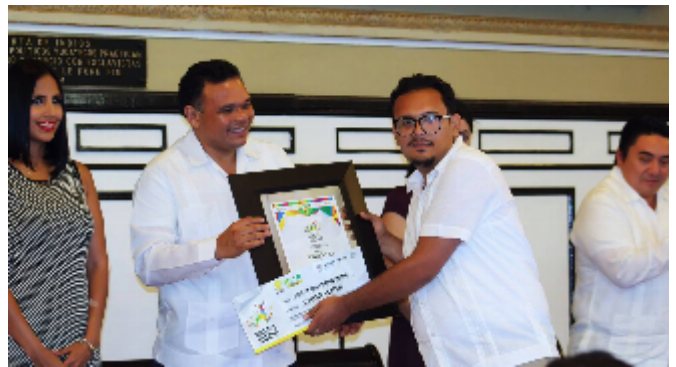
Recepción del Premio Estatal de la Juventud en artes 2014