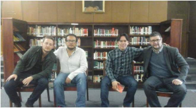
Visita al Gimnasio Moderno (Colombia, 2015)