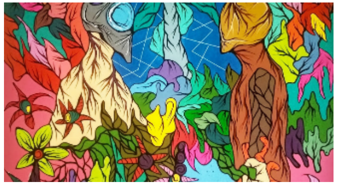
"La ultima frontera" 2020