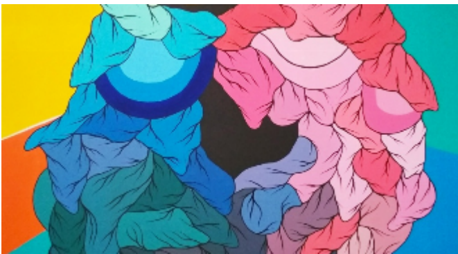
"Gen modificado" 2018