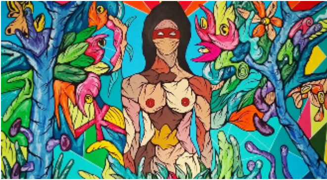
"Madre observa" 2019