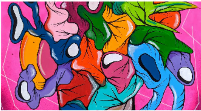
"Metamorfosis I" 2022