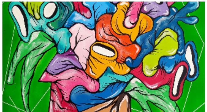
"Metamorfosis II" 2022