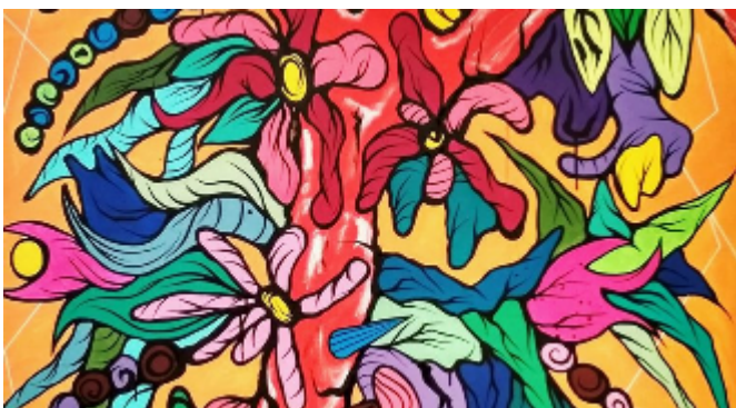
"El arbol rojo" 2019