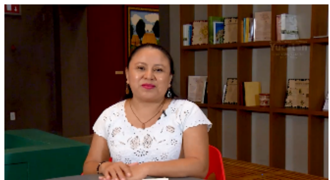
Clases maya, 2020, redes