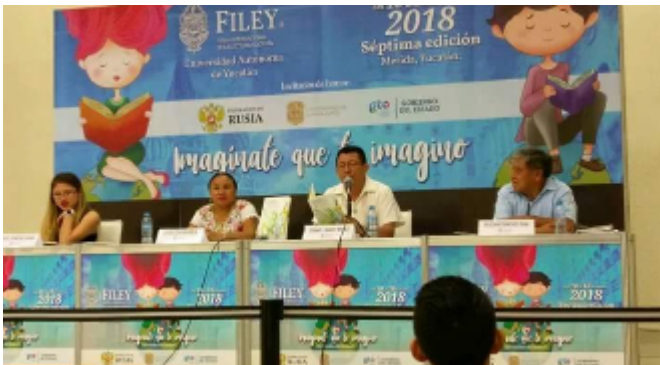
Charla en Filey 2008 sobre lengua Maya, de redes