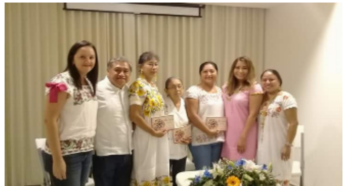
Presentación de Libro Colectivo, 2018, redes sociales