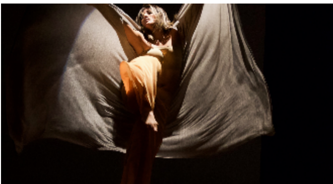
El manifiesto. Ensamble de improvisadores...al Olimpo. 2019.