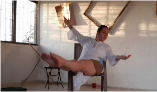
Actos. Dispositivo de improvisación 2. Temporada #mundosemergentes.