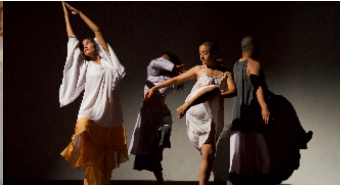
El manifiesto. Ensamble de improvisadores...al Olimpo. 2019.