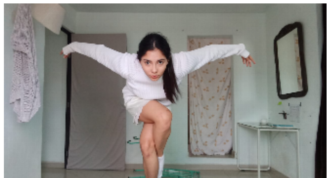
Actos. Dispositivo de improvisación 2. Temporada #mundosemergentes.