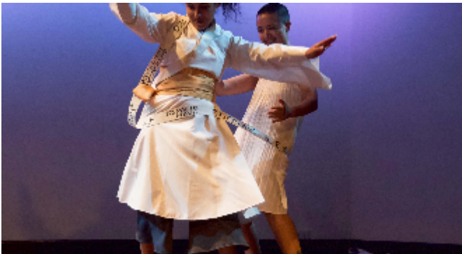
El manifiesto. Ensamble de improvisadores...al Olimpo. 2019.