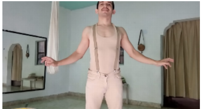
Actos. Dispositivo de improvisación 2. Temporada #mundosemergentes.