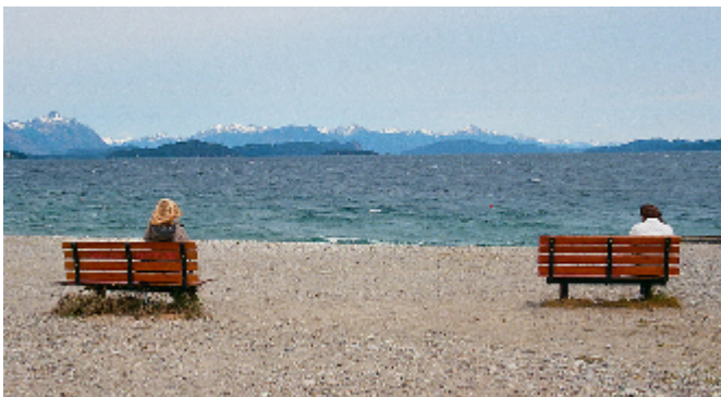
Sin título, 2020. Fotografía análoga.