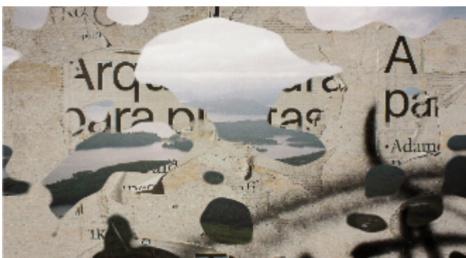
Arquitectura para plantas, 2020. Fotografía análoga con intervención digital. (1/2)