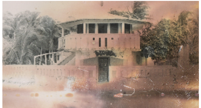
Gamma Solution, 2019. Fotografía análoga con interrupción química.