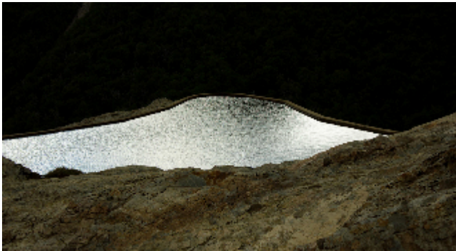
1620 m.s.n.m, 2020. Fotografía digital.

Laboratorio de Imagen, Galería ESAY, Mérida. 2018 Qué noche, cuál ciudad, Escuela Superior de Artes de Yucatán, Mérida. 2017 Diálogo Gráfico, ESAY, Mérida. Proyectos curatoriales: 2020 Exposición virtual "100 años de Judith". Muestra del acervo fotográfico de la pianista y compositora Judith Pérez Romero. Curaduría y montaje web. Experiencia profesional: 2020 - 2021 Asistente del Taller de Medios Audiovisuales de la Escuela Superior de Artes de Yucatán. 2020 - 2021 Gestora y curadora del proyecto de preservación, catalogación y documentación del archivo fotográfico de la pianista y compositora Judith Pérez Romero, Programa Iberarchivos (Madrid) - ESAY. 2019 - 2020 Asistente del Taller de Fotografía de la Escuela Superior de Artes de Yucatán. 2016 - 2017 Fotógrafa y Asistente de Producción Cinematográfica en Macario Producciones, Estudios Churubusco, Ciudad de México.