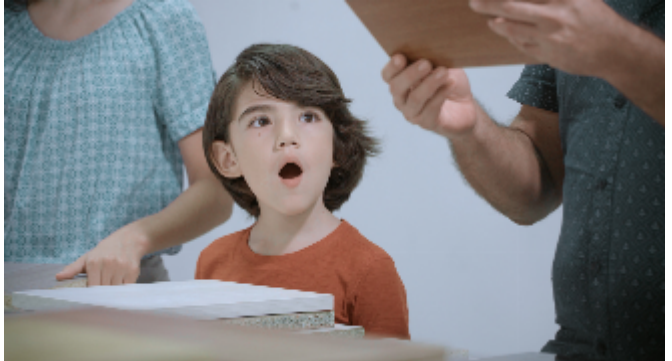
Bochetti, Cocinas y Clósets: Liebre por Gato (2021)